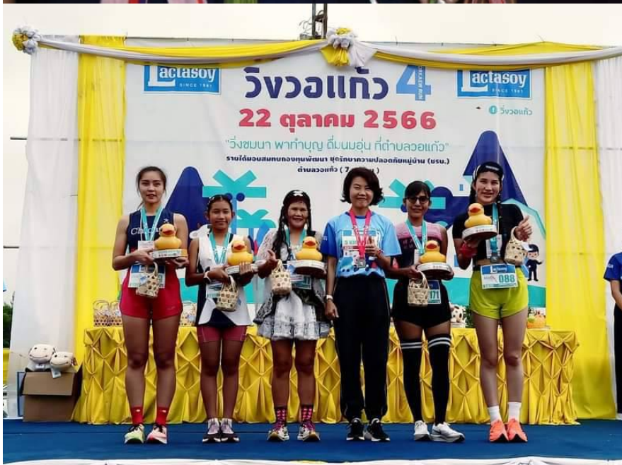
เมื่อวันที่ 22 ต.ค.2566 ที่ จ.ลำปาง ผู้สื่อข่าวรายงานว่า ณ โรงเรียนวอแก้ววิทยา ต.วอแก้ว อ.ห้างฉัตร จ.ลำปาง องค์การบริหารส่วนจังหวัดลำปาง ร่วมกับอำเภอห้างฉัตร มหาวิทยาลัย ธรรมศาสตร์ ศูนย์ลำปาง องค์การบริหารส่วนตำบลวอแก้ว ร่วมกันจัดกิจกรรม วิ่งวอแก้วครั้งที่ 4